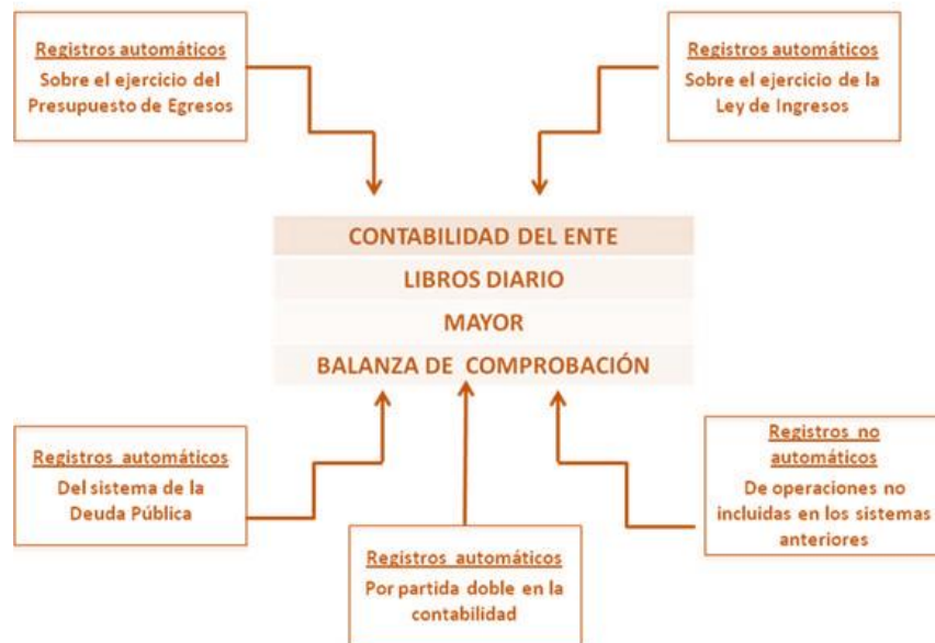
Esquema de Integración de los Asientos Contables en la Contabilidad Gubernamental

6 A partir de la información contenida en la Balanza de Comprobación de Sumas y Saldos, se elaboran automáticamente los estados contables, presupuestarios, programáticos y económicos que requiere la Ley y que ya fueron referidos anteriormente.